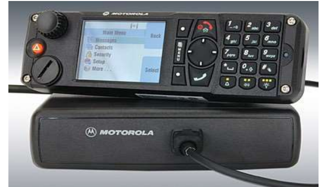
MTM5x00 egybeépített kivitel